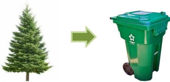
Los árboles naturales van en el bote verde